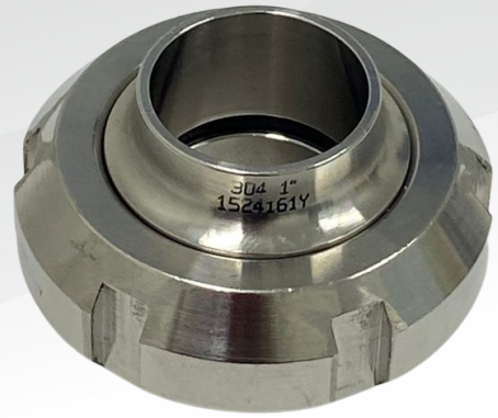
UNIÃO 1"- MONTADA