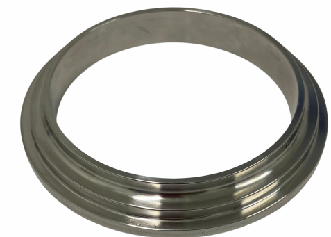
UNIÃO 3"- NIPLE