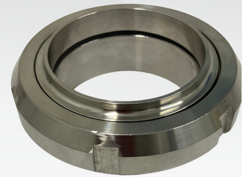
UNIÃO 3"- MONTADA