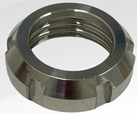
UNIÃO 1"- FÊMEA