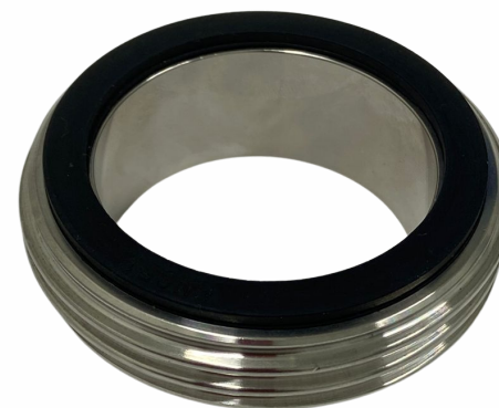
UNIÃO 2"- MACHO