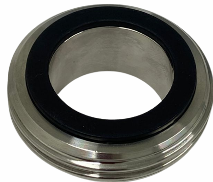
UNIÃO 1.1/2"- MACHO