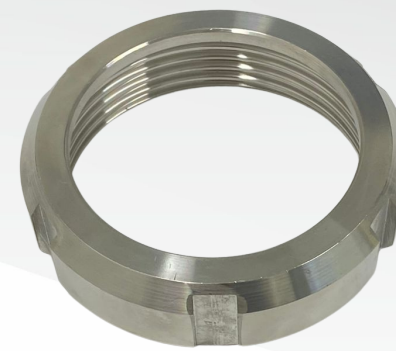
UNIÃO 2.1/2"- FÊMEA