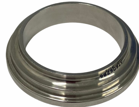
UNIÃO 2"- NIPLE