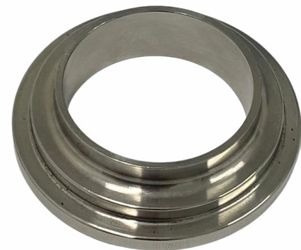
UNIÃO 1.1/2"- NIPLE