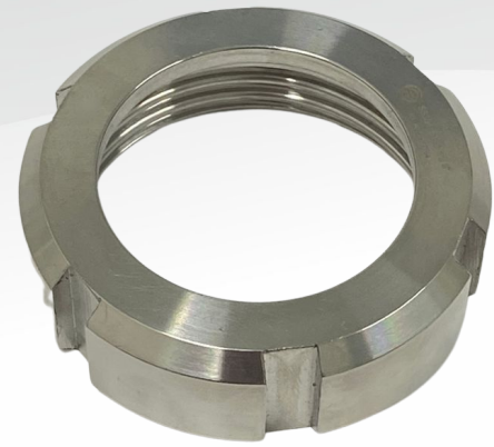
UNIÃO 1.1/2"- FÊMEA