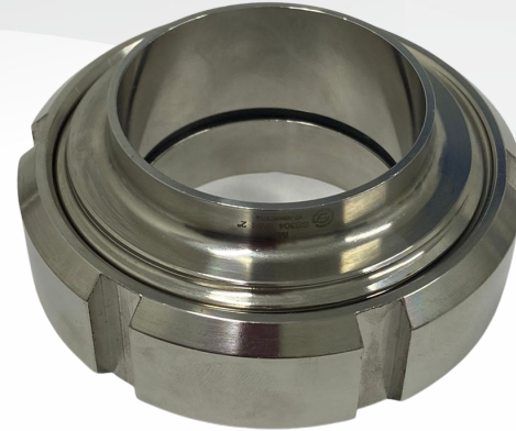
UNIÃO 2"- MONTADA