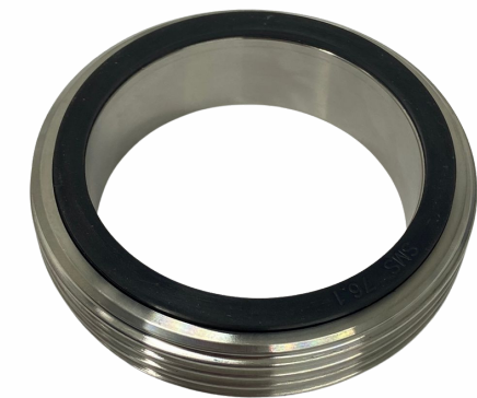
UNIÃO 3"- MACHO