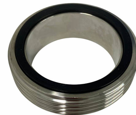
UNIÃO 2.1/2"- MACHO