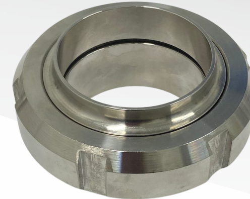
UNIÃO 2.1/2"- MONTADA