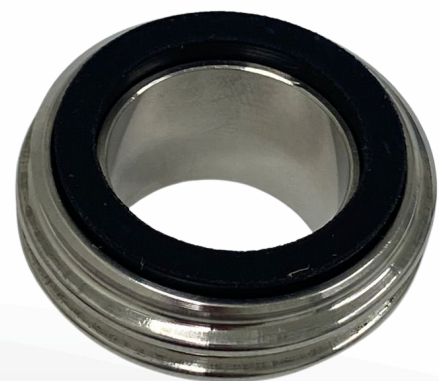
UNIÃO 1"- MACHO