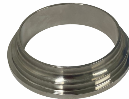
UNIÃO 2.1/2"- NIPLE