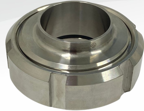
UNIÃO 1.1/2"- MONTADA